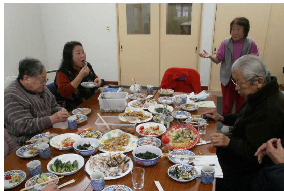
浮間の生活と健康を守る会新年会にて

共産党北区議団ではこの報告書を全面的に生かして区が本気で「長生きするなら一番」の北区をめざすよう提案していく決意です。